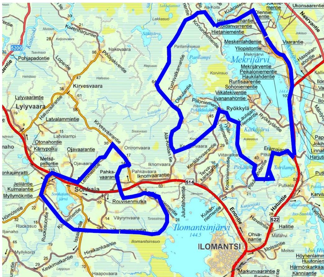
Kuva 2. Osayleiskaavaan päivittämiseen mukaan otettavat lisäalueet.

Kirkonkylän ja ympäristön osayleiskaavan päivittäminen on aikataulutettu siten, että kaavoitusprosessi kestää noin kaksi vuotta. Tavoitteena on saada uusi osayleiskaava voimaan vuoden 2020 aikana.